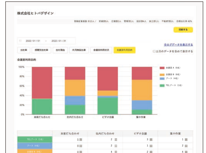
会議室などの利用理由