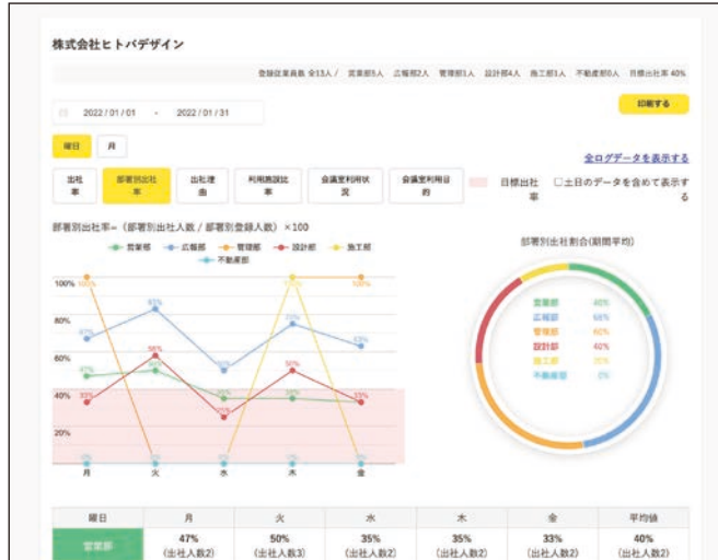
部署別の出社状況