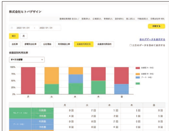
会議室や集中ブースの利用状況