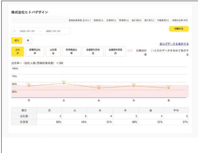
出社状況の可視化