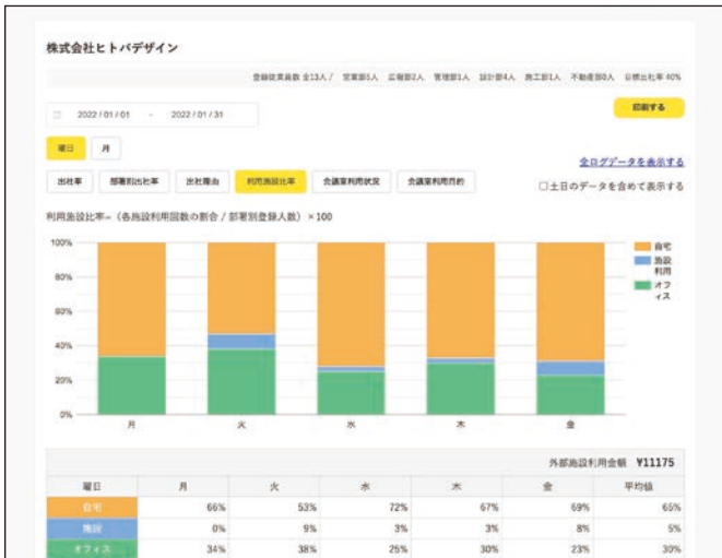
オフィスやサテライト施設の利用状況