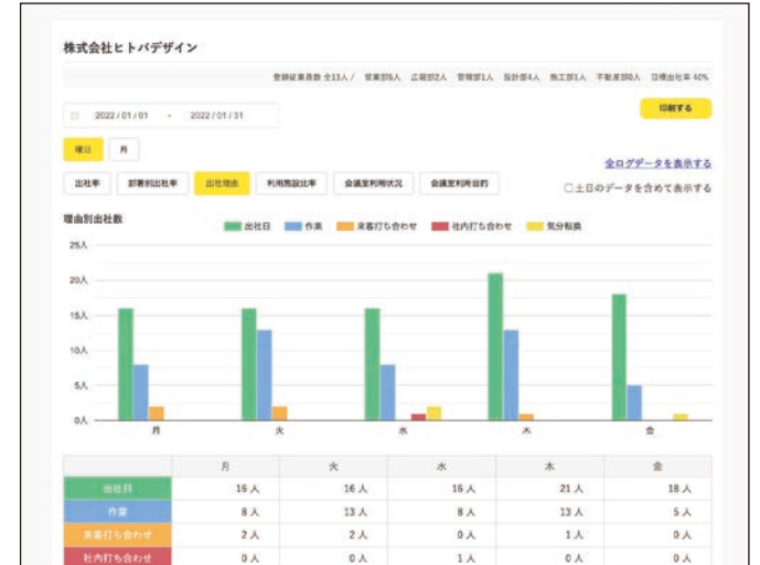
オフィスへの出社理由